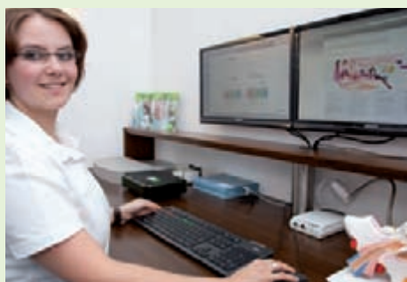
Verarbeitung der Daten am Computer

Individuelle Ohrabformungen werden im Hörcenter Dirks bereits seit 2005 digitalisiert und für die Fertigung von Ohrstücken und Im-Ohr-Hörgeräten weiterverarbeitet.