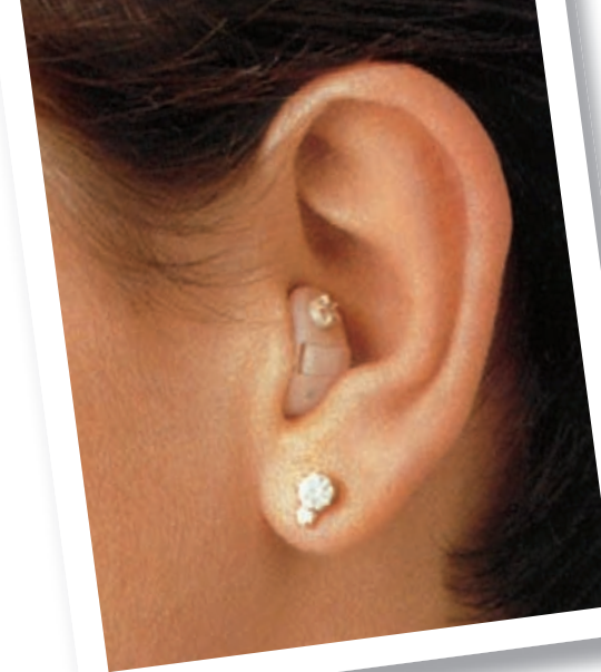
Siemens-Werbemotiv zum ersten seriengefertigten Im-Ohr-Hörssystem »Cosmea Top« aus dem Jahr 1983

1983 lieferte die Siemens Audiologische Technik erstmals ein individuelles Im-Ohr-Hörgerät in Serienfertigung aus – ein historischer Rückblick